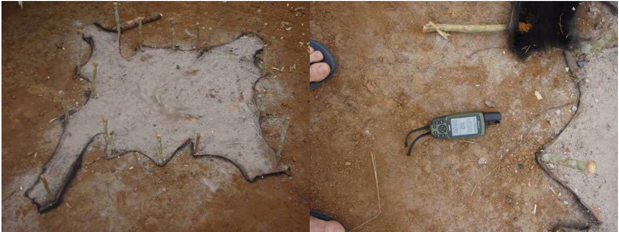
Photo 1 : Peau de grand singe (gorilles ou chimpanzé) séchant au soleil sur la piste, UFE Lé Boulou (Niari).

Par ailleurs, lors de sa mission, l'OI a observé la présence d'une peau de grand singe (gorille ou chimpanzé - animaux intégralement protégés en République du Congo) en séchage au sein de l'UFE Lé Boulou (photo 1), sur la piste principale menant au VMA 2008.