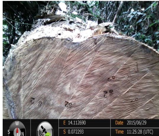
Figure 1: Moabi fût n° 82 avec "COD Z3"

→ Emploi des manœuvres frauduleuses pour se soustraire au paiement de la taxe d'abattage caractérisées par la non numérotation des arbres abattus abandonnés pour cause de défaut. En effet, l'OI-APV FLEGT a retrouvé 4 fûts, abandonnés dans les lieux d'abattage, qui ne portent pas de numéros, ainsi que leurs souches.