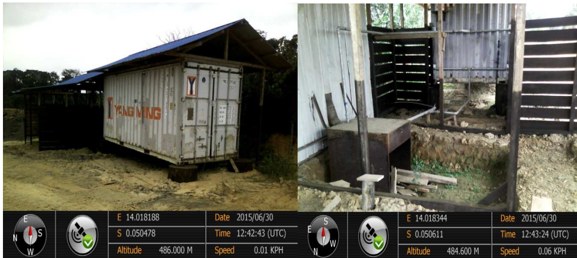
Figure 2: Séchoir traditionnel CDWI

La société CDWI n'a pas d'unité de séchage ni de menuiserie. Elle se contente, pour le premier cas d'une technologie traditionnelle (cf. Photo ci-dessous) pour faire le séchage du bois.